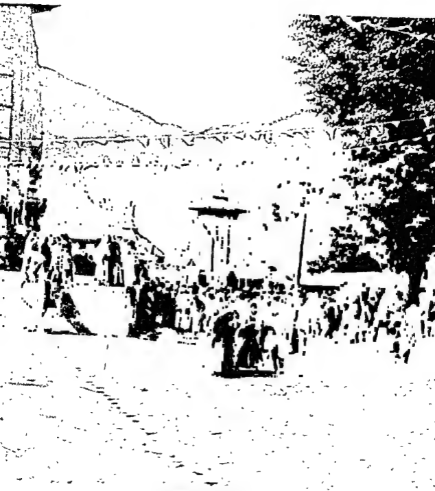
भरुवार के मन्दिरों में